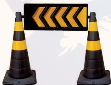
SETA TIPO PLACA