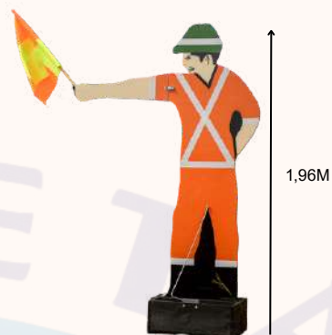
BONECO DE MADEIRA