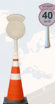
PAINEL PARA CONE