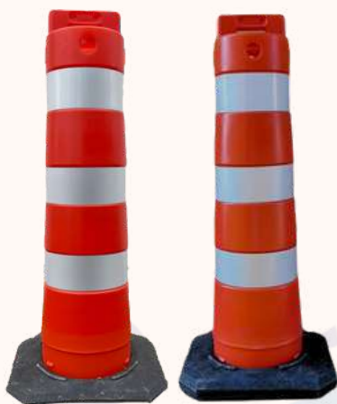
Base Borracha Maciça