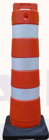
Base Enchimento de Areia