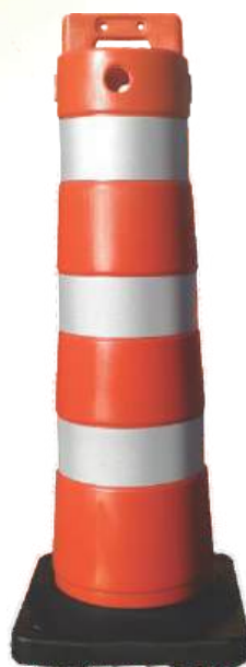
Balizador Robusto Econômico Pesado Peso Total de 3 kg até 8 kg