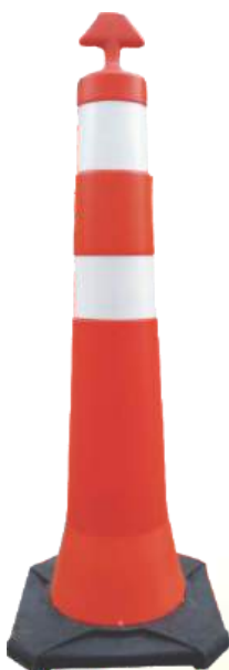
Balizador Cônico T Base Maciça Peso Total 4,5 kg