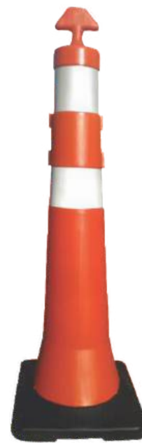
Balizador Cônico T Econômico Pesado Peso Total de 2,5 kg até 7 kg