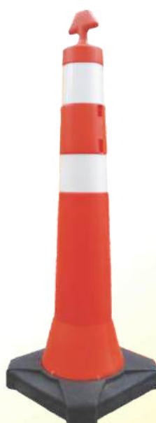
Balizador Cônico T Base Maciça Peso Total 8 kg