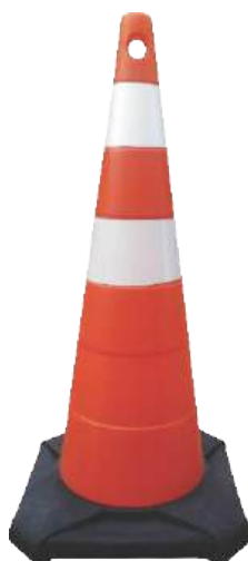
Cone 95 cm Base Maciça Peso Total 4,2 kg