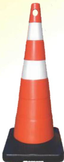
Cone 95 cm Econômico Pesado Peso Total de 1,8 kg até 7 kg