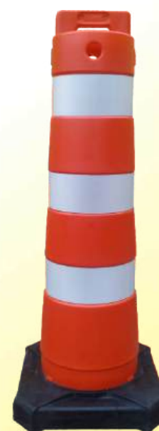
Balizador Robusto Base Maciça Peso Total 8 kg