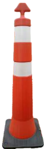
Base com Enchimento Peso Total 4,5 kg

Fabricação Padrão nas Cores Laranja com Refletivo Branco ou Preto com Refletivo Amarelo, outras cores sob consulta.