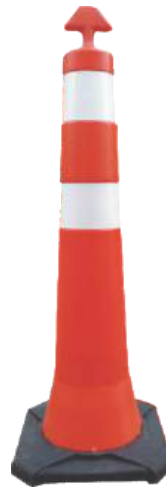
Base Maciça Peso Total 5,5 kg