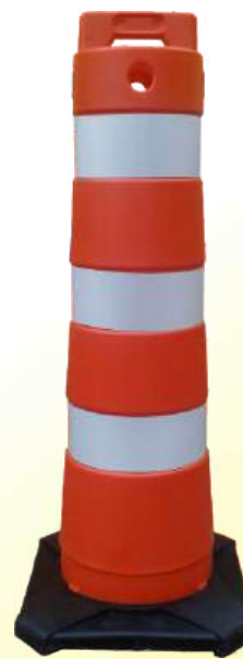
Balizador Robusto Base Maciça Peso Total 5,5 kg