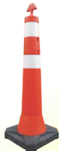
Base Maciça Peso Total 8 kg