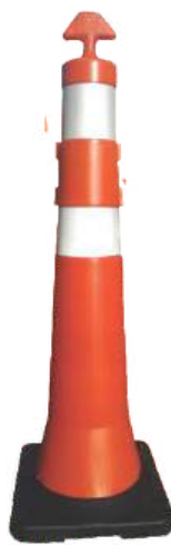
Base com Enchimento Peso Total 7 kg